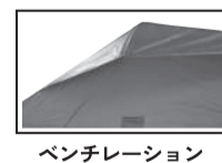
ベンチレーション