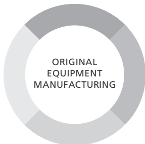
[ OEM製品 ]