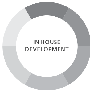
[ 自社開発製品 ]

出してきました。さらに、この経験を活かして自社ブランド「カンタンタープ」を立ち上げ、いまではワンタッチテントのNO.1ブランドにまで成長しています。これからもニューテックジャパンは、これまで培ってきた提案力と技術力、そして先進的な生産力を駆使して、より魅力的な製品を作り続け、“ニーズ以上の満足”をお届けしていきます。